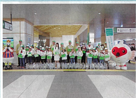
新潟駅で街頭募金を実施 (公社)にいがた緑の百年物語緑化推進委員会・新潟市

県民の皆様、ご協力ありがとうございました。 寄せられた「募金」は、さまざまな緑に変わりました。