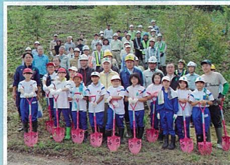
卒寿の森 (1人16本の木を植える) 活動 (卒寿の森実行委員会・三条市)