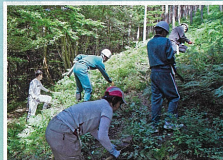
森づくり事業にて学校林の下刈り作業 (佐渡市立松ヶ崎中学校・佐渡市)