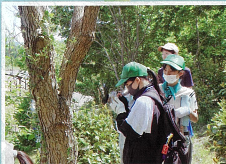
森づくり事業にて樹木プレートの設置 (特色のある緑の公園を造る会・村上市)