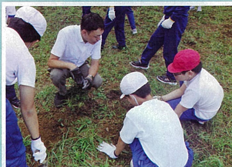
桜の保全活動 (糸魚川地区緑の少年団交流集会・糸魚川市)