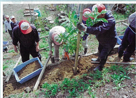
記念植樹事業での植樹風景 (NPO法人関原里山・ぬかやま会・長岡市)