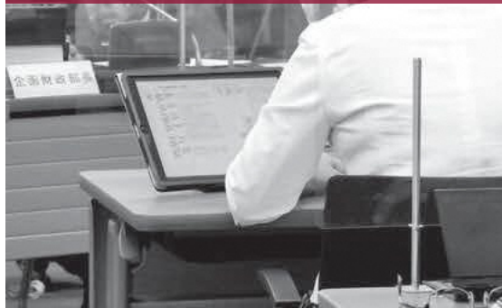
決算審査初日、6会派が初となる代表質問を実施した