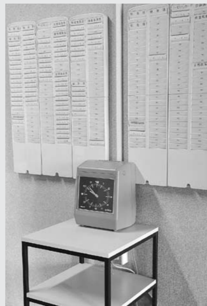
各庁舎職員玄関にあるタイムカード

勤務時間減により仕事量が増え、内容も多様化しているが、定員適正化も含め職員も頑張っている。時間外勤務手当については特殊なものを除き、毎年度下がっており15分短縮についての影響はない。ただ、15分短縮による住民サービスへの影響を懸念しており、窓口業務等は出勤、退庁時間を15分移動シフトした形で対応を考えている。