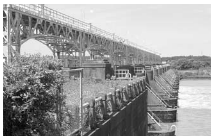
可動堰=洪水など必要でない流水を海に流出

先の旧洗堰は産業遺産として現地に残っていた。歴史的背景からも旧洗堰同様、現可動堰も残してほしいと要望し