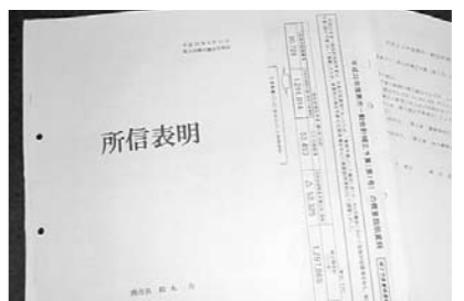
市長所信表明と補正予算資料

問② 骨格予算である一般会計の当初予算額は333億3500万円であり、前年度当初に比べて23億8400万円、6.7%減。一般会計補正予算案が総額