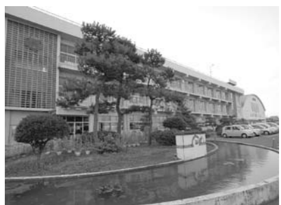
改築事業が待たれる吉田小学校

らは、工事中の安全確保や児童の活動に制限が大きいこと、駐車場の不足すること、設計の自由度が大幅に制限されることなど、さまざまな問題が出されているところがございます。