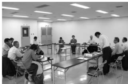
燕市行政改革推進委員会

答④ 県に移管される構想もあることから、情報収集に努め要望していく。 問⑤ 分水新町の雨水対策はいづろになるのか。 答⑤ 西川管理者との協議が整い、秋以降に行う。