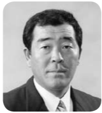
土田 昇 議員 日本共産党議員団