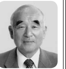
本多 了一 議員 日本共産党議員団