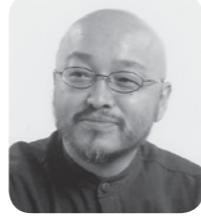
タナカ・キン 議員 相如

マに応じて専門部会を設置し、議論や提案、実証実験を行い、それらを具体的な施策に反映していくとする仕組みができている。 燕市でも廃棄物減量等推進審議会が設置されている。ごみの減量、再利用の促進に向け、町田市のごみゼロ市民会議を勉強したい。