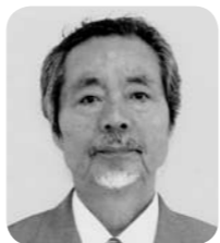
阿部 健二 議員 相如