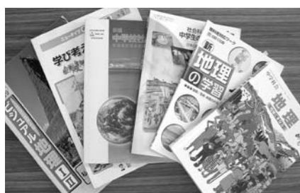
分水中学校で使用されている社会科教材

分水中学1年生の例をとると、教科用図書1冊以外に平均4冊くらいの参考図書を購入しなければならぬ。これらを含め「教育立市」宣言しているなら、ある程度の行政負担を考えてはどうか。