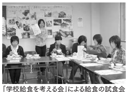
「学校給食を考える会」による給食の試食会

答④ 母親と分かち合うメモリアルカードの取り組みは担当に指示した。家庭教育講座も先進地などの事例も含めて検討を指示した。