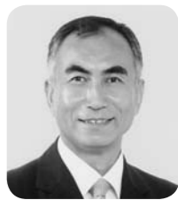
長井 由喜雄 議員 日本共産党議員団