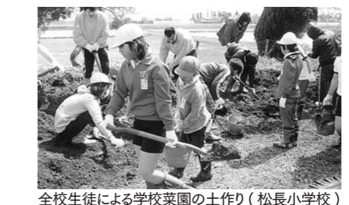
全校生徒による学校菜園の土作り(松長小学校)

問③ 公営住宅は将来建て替える必要と思うが、その間、地域住民に開放して畑や駐車場等に活用し管理をしっかりとらなくてはどうか。