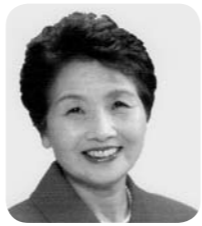
金子 正子 議員 公明党議員団