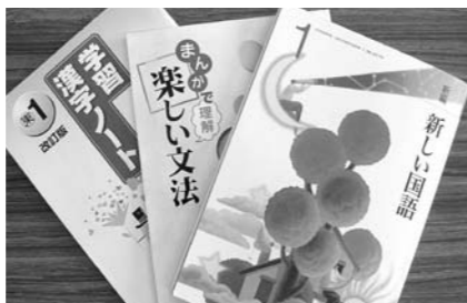
主要教科では最低でも3冊は使用

答① 義務教育の授業料は月謝と考えられ、無償とするとの規定には給食費や学用品などは授業料に含まれないと考えられます。教科用図書、すなわち教科書は、教科の主たる教材として授業の用に供される児童、生徒用図書で検定を経たものと規制されています。参考図書は教科用図書以外の有益、適切な図書は使用できる規定があります。