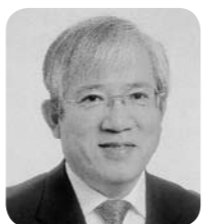
埴 豊 議員 七星会

となっていないか。 答③ 戸別所得保障は、5月末日現在で637件の申し込みである。大きな問題点はない。不作業付け地が3年後に改善できない場合の補助金返還は、国に問い合わせても返事が無い。栽培方法による減収率は、21年までの過去7年間の坪狩りデータを基にしている。