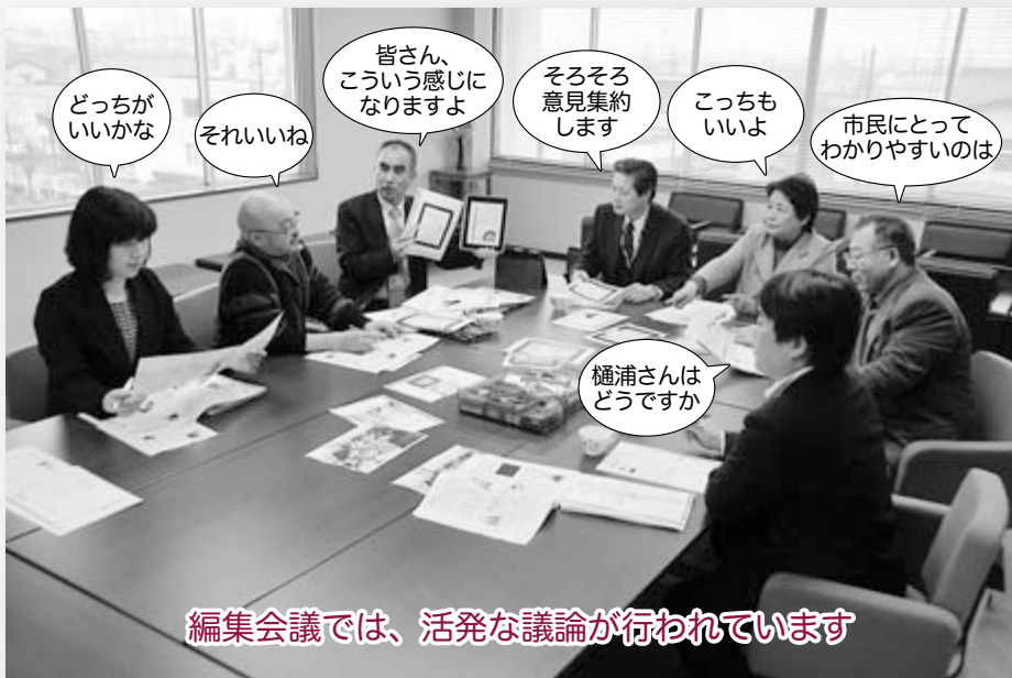
編集会議では、活発な議論が行われています

るよう作業している。火力発電施設は飽和状態で燃料高騰による電気料金値上げは、地域経済の活性化雇用への影響が心配される。 問 燕中等教育学校の生徒の態度や振る舞いには、毅然さと日本人としての礼節さがある。他校の教育現場も見習ってほしい。 答 今後市内の学校との交流を深める機会を設け、互いに切磋琢磨していく。