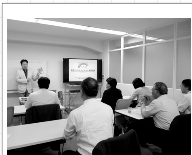
情報保障、幅広い視点で検討していきたい

障がいのある方々のみならず、高齢者や小さな子どもなど、さまざまな人たちの人生をより豊かにする取り組みの必要性を感じる研修となりました。