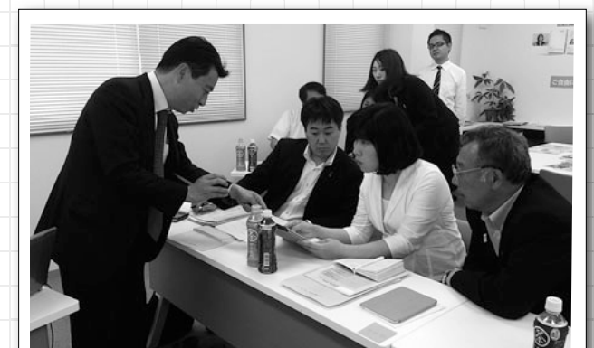
タブレット端末を使った議会情報配信も増えているんです

会議録検索や議会映像の配信など、これからの「議会情報がどうあったらいいのかわからない」「提供のあり方」について学びました。燕市議会も9月定例会から映像配信を始めようとしています。