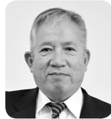
⑯ 埴豊 4期・1949生 花見 60 ☎ 63-8677