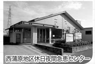
西蒲原地区休日夜間急患センター