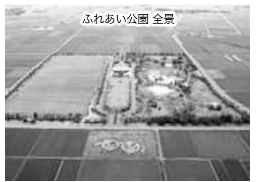
ふれあい公園 全景