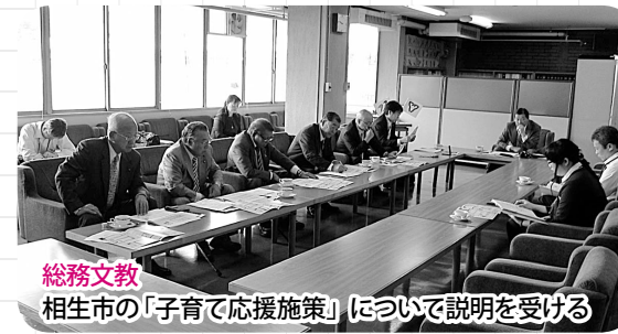
総務文教 相生市の「子育て応援施策」について説明を受ける