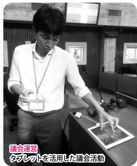
議会運営 タブレットを活用した議会活動

議会のIT化を中心とした議会改革について3市を視察した。人口の多い 奈良県奈良市 、 三重県鳥羽市 では、タブレットと運動した大パネルを使用した一般質問を実施している点が興味深かった。 IT化を中心とした取り組みは、理事者側を含めて検討すべきであり、3市で学んだことを参考に、情報発信と共有化を図り、市民から信頼される議会を目指すべきであると改めて感じた視察となった。