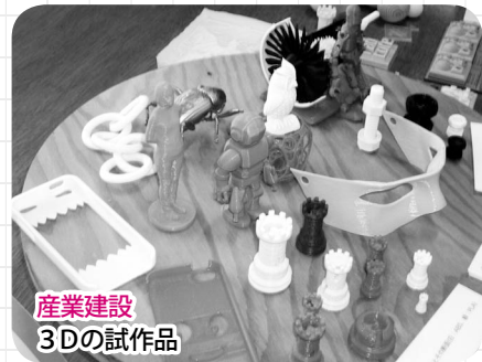
産業建設 3Dの試作品

燕市議会の3常任委員会と議会運営委員会では、毎年視察を行っています。各委員長より、その内容について報告いたします。