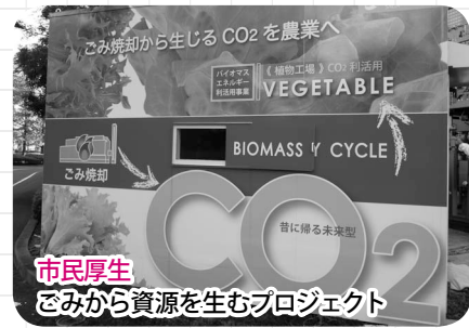
市民厚生 ごみから資源を生むプロジェクト