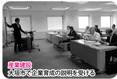
産業建設 大垣市で企業育成の説明を受ける