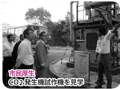
市民厚生 CO2発生機試作機を見学