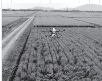
最新機器ドローン等で農業はどうなる？

績としては、ドローン1台と、その他に規模拡大支援として無人ヘリコプター、複合営農支援では枝豆サヤ取機の導入実績があり、本事業は確実に実績を上げていると考える。