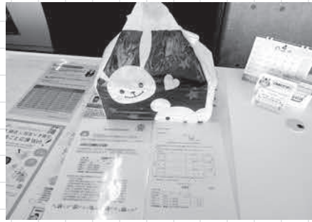
ゴミ袋は可愛い袋に包まれ配られる

答 令和2年4月1日以降に生まれた子には、1年分10セットを3年間支給する。市外からの転入の場合も同じ条件で支給する。