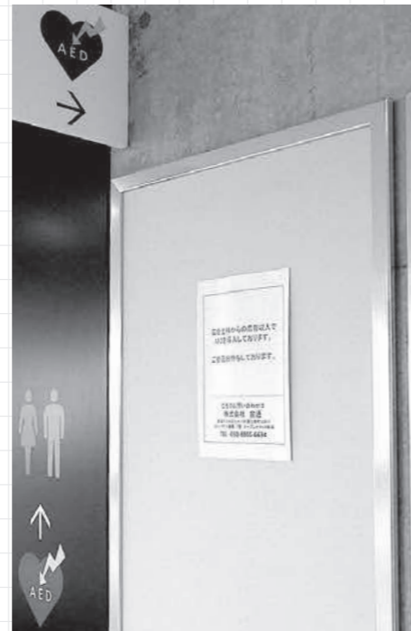
全国的にも珍しい広告付AED

万円から3万円に下がった。また、今年度から無料の広告付AEDを庁舎などに設置して、コストを削減している。 問 防犯カメラ設置補助金120万円