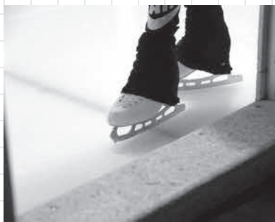
燕製のブレードを履いて表彰台を！

答 フィギュアスケートのブレード市場は、欧米のメーカーが主流であるものの、品質の向上を求め燕市に要請があり、要求品質に見合った製品が出来上がりインストラクター協会からも評価を頂いた。インターネット販売を主流に考えている。