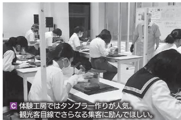
C 体験工房ではタンブラー作りが人気。観光客目線でさらなる集客に励んでほしい。