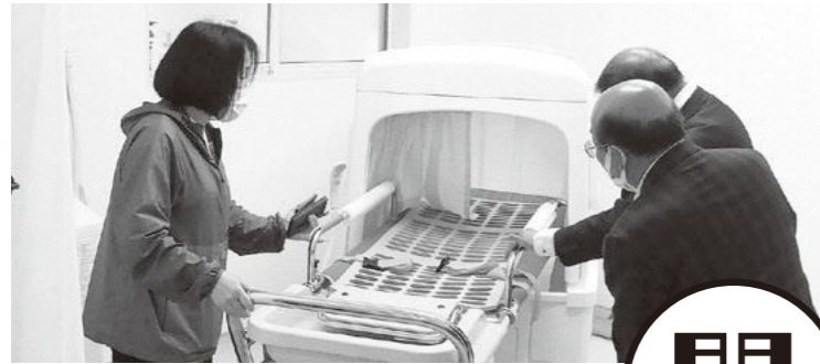
市 ロンディーネの杜