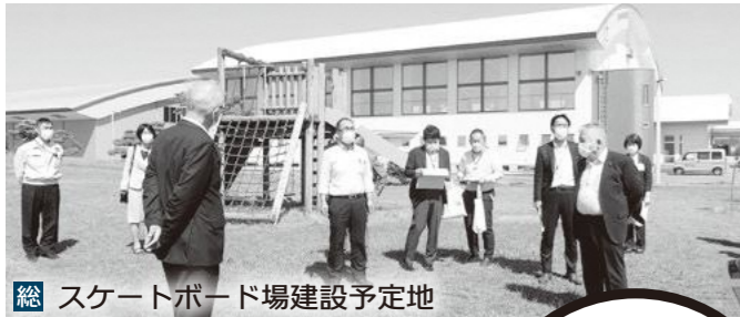
総 スケートボード場建設予定地