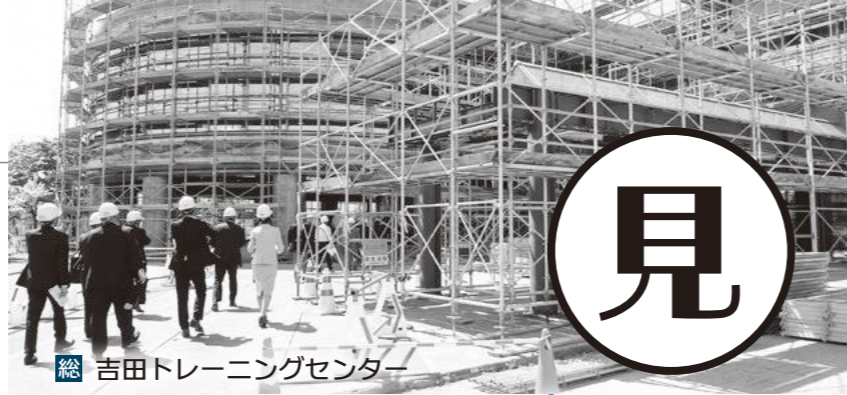
総 吉田トレーニングセンター

A 水耕栽培による野菜生産とその販売等を通じて、就労支援を行っている。水耕栽培で主に作っているものはレタスやにんじく、スプラウトなど。