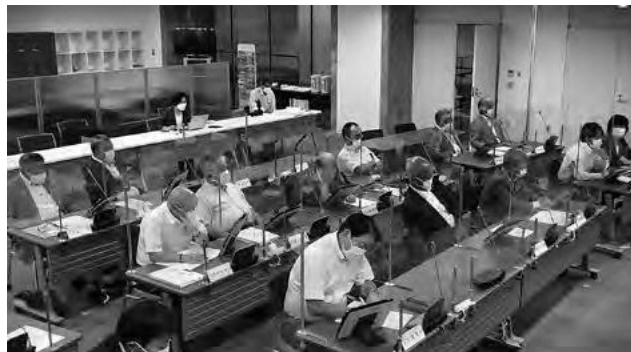
鋭く切り込んだ決算審査を行っていく、臨場感あふれる様子が伝わる

これからはさらに、スマートフォンやインターネットで「いつでも」「どこでも」「誰でも」簡単に傍聴できる会議を実現していきます。身近な議会、開かれた議会を市民の皆さんに感じてもらい、議会に関心を持ってもらう取り組みをさらに進めていきます。