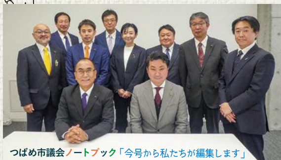
つばめ市議会ノートブック「今号から私たちが編集します」

議会だよりは年4回(2月1日・5月1日・8月1日・11月1日)発行。各戸配布のほか、議会ホームページやスマートフォンアプリ「マチイロ」からもご覧いただけます。