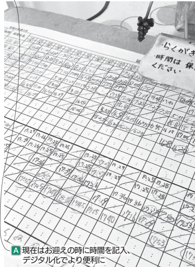
A 現在は迎えの時に時間を記入、デジタル化により便利に