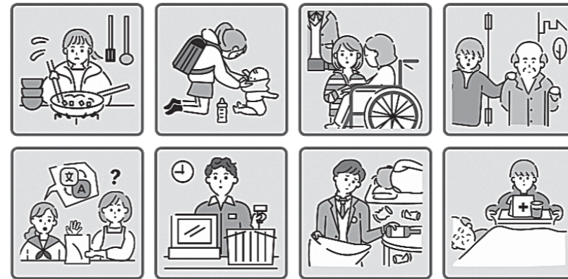
B 知っていますか? ヤングケアラー (イラスト出典 厚生労働省)