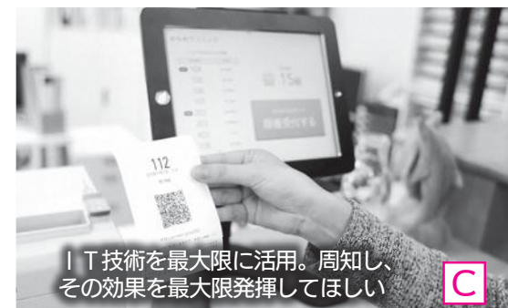
IT技術を最大限に活用。周知し、その効果を最大限発揮してほしい