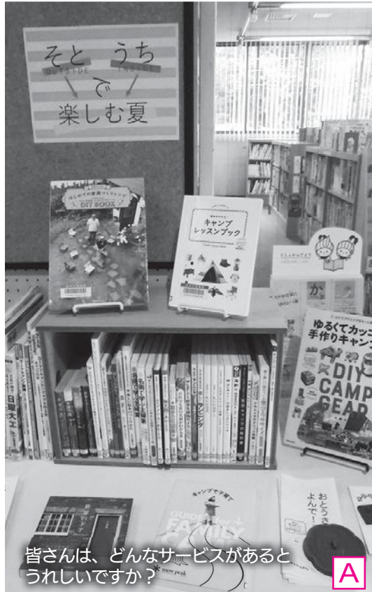
皆さんは、どんなサービスがあると嬉しいですか?

指定管理者の指定について(燕市立図書館 ほか2施設) 図書館のサービス向上期待。電子図書館なども導入予定 問 指定管理料の適正化や支払う金額相応のサービスが必要では。どのサービスが必要なのかなど、見極めが非常に大切になってくる。指定管理者の上限額についても、求めるサービス内容と管理料が連動することから今後精査していきたい。 答 指定管理料の適正化は、指定管理ではなく直営とすべき。市の委託額は、直営との大きな相違がなく、承服できない。 賛成討論 指定管理者制度は、市民のためになるのかというのを考えながら行ってほしい。図書館のこれからのサービス向上を期待する。