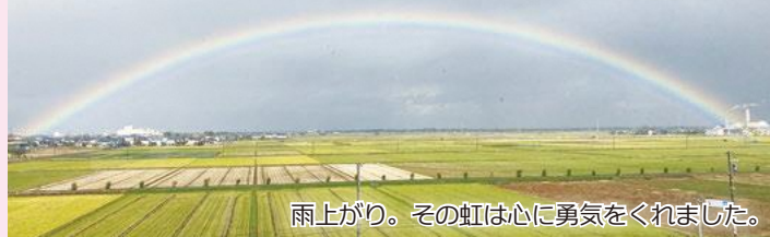
雨上がり。その虹は心に勇気をくれました。

庁舎4階から、美しい虹を見ることができました。その虹は、暗い気持ちに優しく寄り添ってくれるようで、思わず足を止め見入ってしまいました。皆と一緒にこの困難を乗り越えていきましょう。