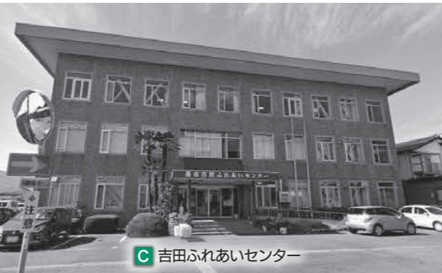
C 吉田ふれあいセンター