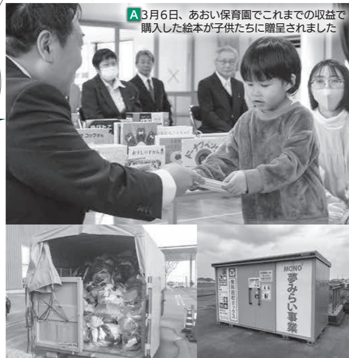
A 3月6日、あおい保育園でこれまでの収益で購入した絵本が子供たちに贈呈されました

答 空き缶の収集量自体は前年度より減っているものの、アルミ缶の売値が急騰していることが収益増につながった。また、絵本や玩具は、公立の保育園・こども園13園及び併設する子育て支援センターに配布する予定です。(写真A) 市