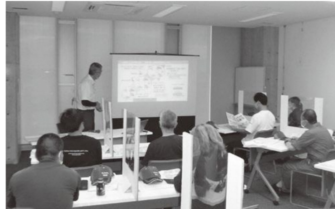
B 技術開発も日進月歩、理解を深めるため勉強会も開催