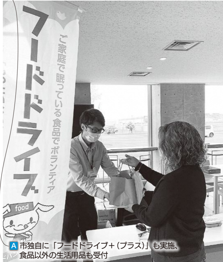
A 市独自に「フードドライブ+ (プラス)」も実施、食品以外の生活用品も受付

問 ひとり親世帯や生活困窮者世帯を支援する対象世帯数と、お米の量はどのくらい調達する予定か。 答 令和5年5月末現在でひとり親世帯は557世帯、令和4年度末の相談件数が67世帯を把握している。購入するお米の量はおよそ750kg程度を想定している。(写真A)