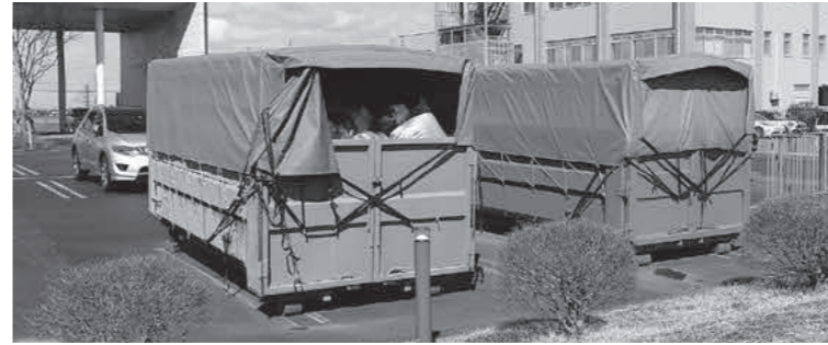
B 市役所の古着類回収コンテナ。再利用可能な古着やアルミ缶などを再資源化し、売却益で子育て支援を行っている

教育機会の均等と 学びを支える奨学金 38人に新規貸付を図る 令和5年度燕市一般会計補正予算(第10号) 奨学金貸付事業 △434万5000円(減額)