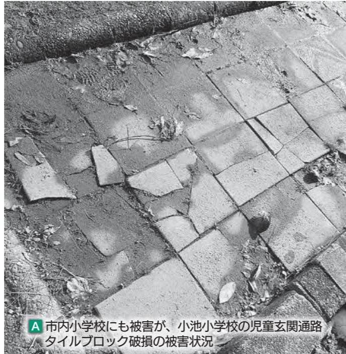
A 市内小学校にも被害が、小池小学校の児童玄関通路 / タイルブロック破損の被害状況

子供たちの安全確保のために 新たな被害が明らかに 令和5年度燕市一般会計補正予算(第10号) 学校教育施設災害復旧費 660万円