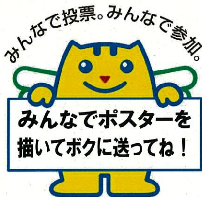
明るい選挙キャラクター めいすいくん