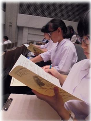
ヒロシマの心を世界に2019見学(8/6)