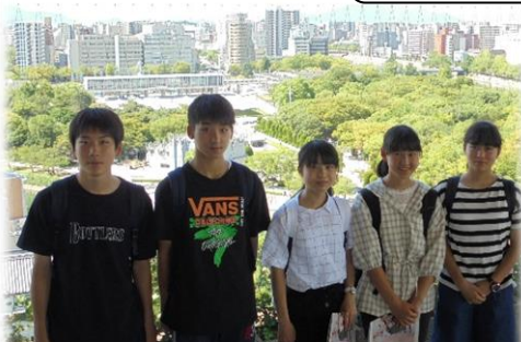
おりづるタワー見学(8/7) 展望台からの広島市の景色に感動