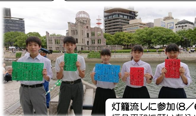
灯籠流しに参加(8/6) 恒久平和に願いを込めて