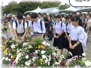
原爆死没者慰霊碑に献花(8/6)