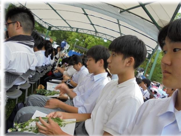
広島市原爆死没者慰霊式並びに平和祈念式に参列(8/6)