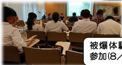
被爆体験記朗読会に参加(8/6)