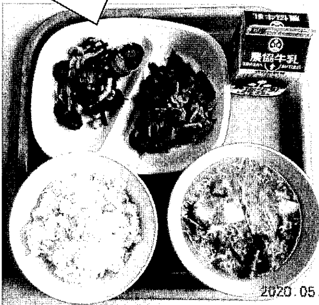
もとまちきゅうりのさっぱり和え

そこで、燕市では毎月 19 日の食育の日に、『 げんえんあい 減塩愛 こんだて ディア献立』を実施し、減塩の大切さや、おいしく減塩できる調理の工夫を紹介していきます。