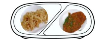
たくあんきんぴら