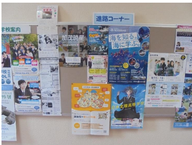
3年生のフロア 進路コーナー