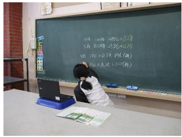
理科室から教室へオンライン授業の練習 カメラに写る範囲を意識して板書しています