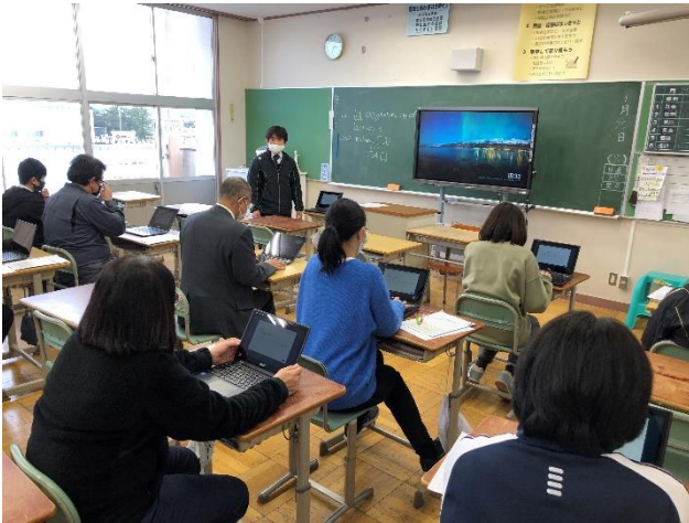
「必要なとき」がスキルアップのチャンス