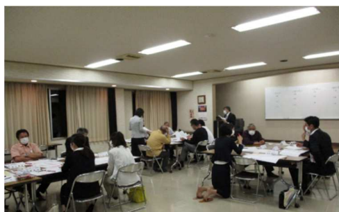
(グループワークによる意見交換)