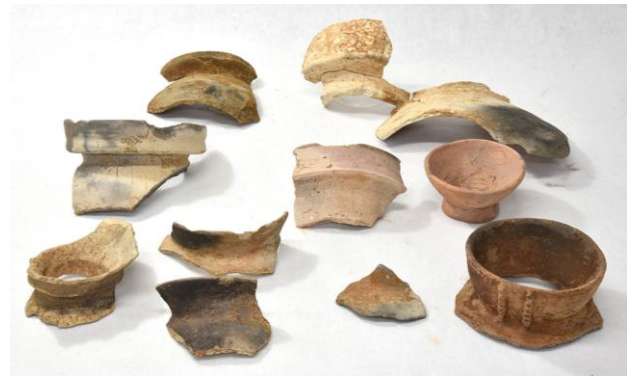
搬入土器や模倣土器 ※石川県以西の特徴をもつ