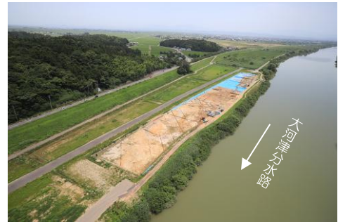
石港遺跡 近景（日本海側から）