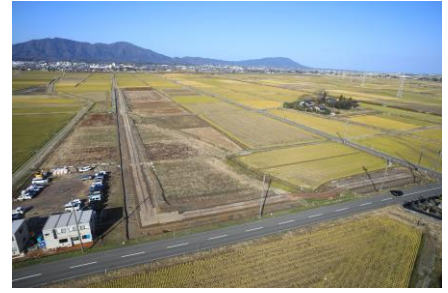
野沖遺跡・仲沖遺跡 近景（南東から）

野沖遺跡からは、奈良～平安時代の土師器や須恵器、鎌倉～室町時代の青磁・白磁、仲沖遺跡からは奈良～平安時代の須恵器や土師器が出土しました。両遺跡からは墨書土器が出土しており、周辺の江添遺跡群や中組遺跡との関係性からも、古代においてこの地域は役人などがかわる生産・流通の要衝であったと考えられます。