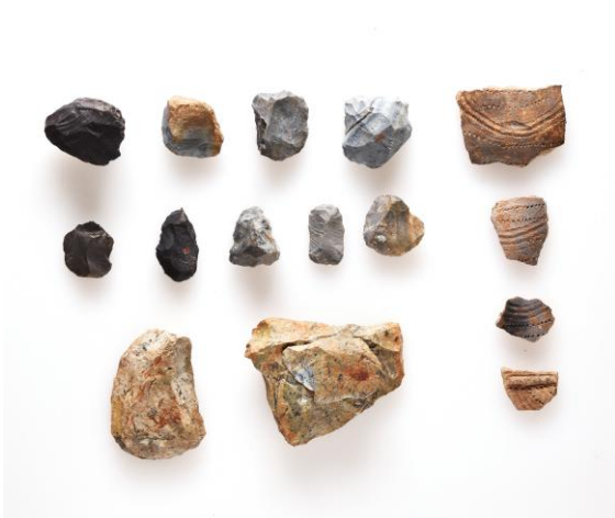
スクレイパー（左）と続縄文土器（右4点）