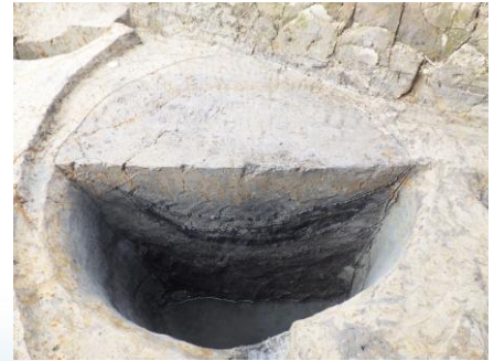
野沖遺跡 B 区 井戸状遺構