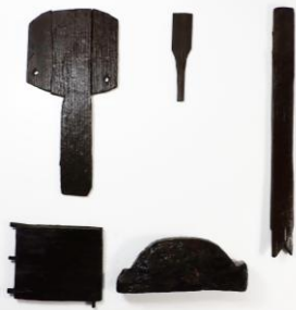
野沖遺跡 B 区 木製品