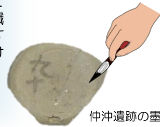
仲沖遺跡の墨書土器

文字が書かれた土器のことです。文字は、施設名や人名、役職などが書かれることが多いですが、当時誰もが文字を書けたわけではなく、役人など地位の高い人物がいたことが考えられます。