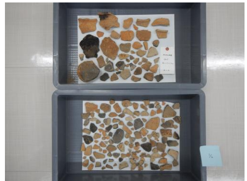
R6 年度調査の出土遺物の一部

令和7年度は、令和6年度に未実施の範囲を調査した結果、遺物は出土しませんでした。少量ながら遺構を検出しました。市内で確認されている古墳時代の遺跡は少ないですが、当地域で古墳時代の人々が活発に活動していた様子がうかがえます。