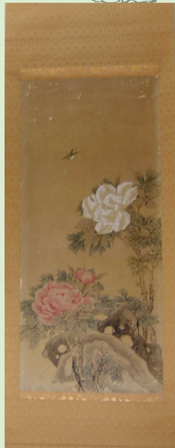
牡丹の図 片桐遜堂 画