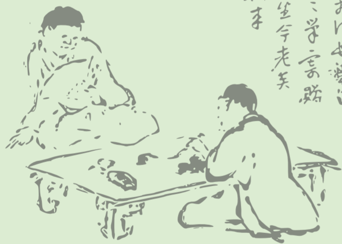
品梅筵 鈴木惕軒 書 片桐遜堂 画