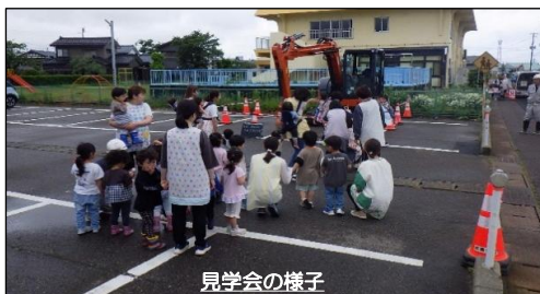
建設機械試乗見学会