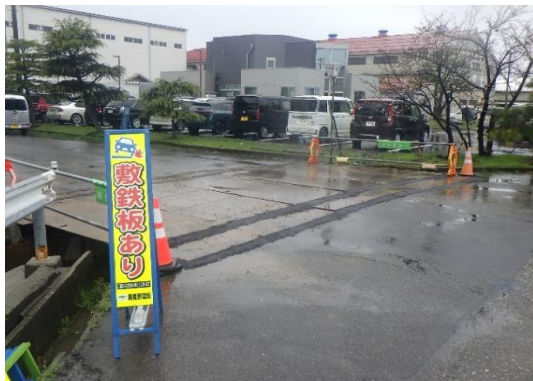
敷き鉄板敷設状況