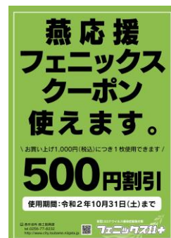
▲掲示されるポスター