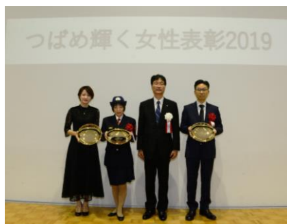
▲昨年度の表彰式の様子