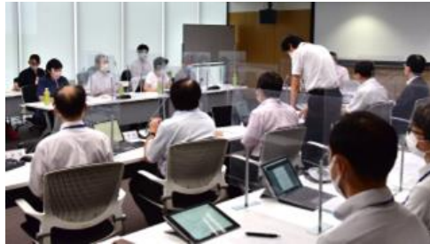
▲燕市行政改革推進委員会の様子

北越工業は、燕市行政改革推進委員会に委員を派遣するとともに、今後、市が実施する行政改革に関する新たな取組に対して、積極的に協力します。