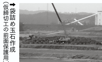
→仮締切工の前面保護用（袋詰め玉石作成）