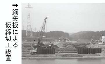
→鋼矢板による仮締切工設置