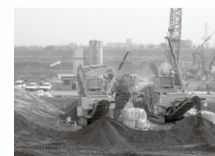
↑土質改良工（この後、信濃川下流の堤防盛土材料などとして利用します）