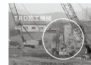
↑連続地中壁工（TRD工法）