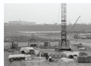
↑管理橋下部工の基礎工（シートの下は基礎工の鉄筋など）