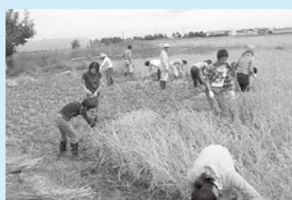
▲風の会 命のつながりを学ぶ講座での稲刈り