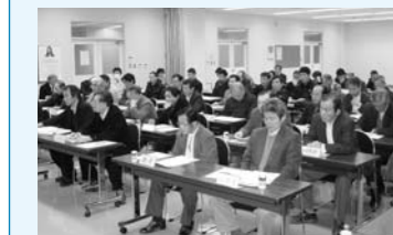
▲燕地区農家組合長会議