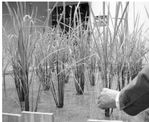
▲地下での水稲栽培（パナソコ2）

11月12日「新潟県農業委員大会」（県央地場産センター）で、燕市農業委員会が県央地区を代表して活動事例発表を行いました。 当委員会がこれまで取り組んできた「米」「米粉」の消費拡大活動を、①「お米料理コンクール」の開催／②「広報つばめ」に「お米を食べましよう！」記事の掲載／③食育・食農ポスターの作成と小学校やイベントでの掲示／④米消費拡大PRシールの作成という4つの柱に基づいて発表。 米消費拡大活動を、全国に発信していくことの大切さについて呼び掛けました。