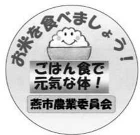
▲米消費拡大PRシール。直径2cmにプリントされています

燕市農業委員会では「米消費拡大運動」の一環として、独自に「米消費拡大シール」を作成しました。ハガキや封筒・名刺などに貼ってPRしていきます。今後さまざまな機会でも、燕産農畜産物の消費拡大（地産地消）活動を進めていきます。