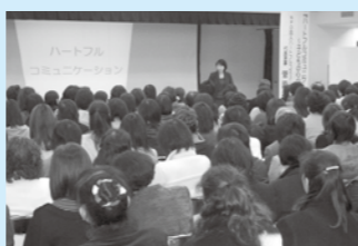
▲はっぴーズ コミュ 子育てコーチング講演会「ハートフルコミュニケーション」