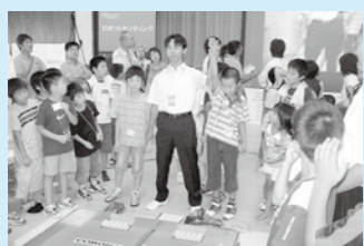
▲社団法人燕三条青年会議所 第3回ふるさとロボコンチャレンジカップ IN 県央