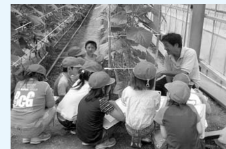
▲小学校の児童が、きゅうりのハウス栽培を見学