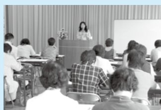
▲つばめ生活学校 「女性と市長との懇談会」事前学習の公開講座