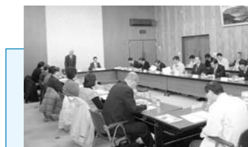
▲燕市水田農業推進協議会総会