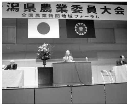
▲「新潟県農業委員大会」での発表

11月12日「新潟県農業委員大会」（県央地場産センター）で、燕市農業委員会が県央地区を代表して活動事例発表を行いました。 当委員会がこれまで取り組んできた「米」「米粉」の消費拡大活動を、①「お米料理コンクール」の開催／②「広報つばめ」に「お米を食べましよう！」記事の掲載／③食育・食農ポスターの作成と小学校やイベントでの掲示／④米消費拡大PRシールの作成という4つの柱に基づいて発表。 米消費拡大活動を、全国に発信していくことの大切さについて呼び掛けました。