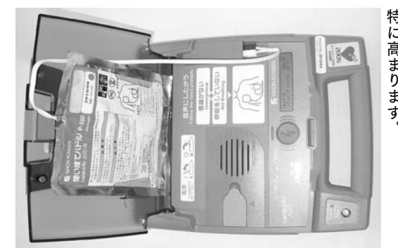
●心停止後、直ちに心肺蘇生法を実施し、5分以内にAEDを用いた除細動を行うことで、救命率は特に高まります。