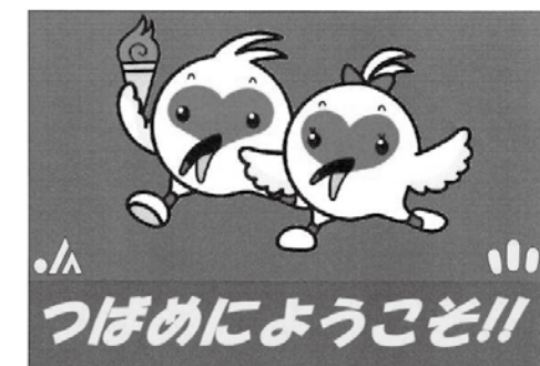
▲今年の田んぼアートは「トッキキ」。鮮やかな稲穂で国体関係者をお迎えします。