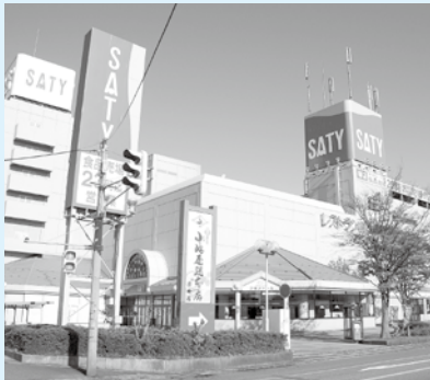
(株)マイカル県央サティ 井土巻三丁目

10月1日から「レジ袋削減・マイバッグ持参市民運動」が始まりました。県央サティもキャンペーンに参加させていただいています。