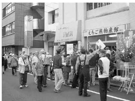
▲初日は50人以上が並ぶ大盛況のスタートとなりました。

●「えちご燕物産館」 住所：東京都墨田区両国 2-18-3(JR 両国駅西口徒歩1分) / 営業時間：午前11時～午後7時(年末年始のみ休業) / ☎03・6659・9970