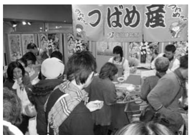
▲常に混雑する多くの人々が訪れました。