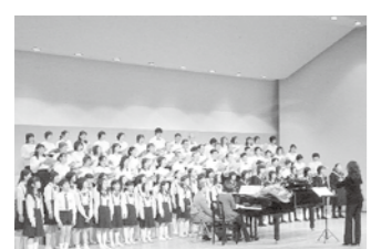
▲「第九を楽しく歌おう会」第九を楽しく歌おう会コンサート