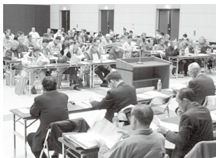
農家組合長会議の模様。（2月15日・吉田産業会館）

市は、平成22年度産米の生産数量目標2万920・86トンの配分を県から受けました。前年と比較べ430・15トンの減少となり、「転作率は36・35%」になりました。 平成22年度から、新たに「戸別所得補償モデル対策」が導入されることから、2月1日から3日まで市内3会場で、新制度についての説明会を開催しました。