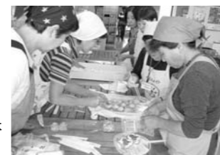
▶大好評だった、おこわだんごの体験実習。

※「お米料理コンクール」優秀賞以上のメニューは、3 月 1 日号までの広報つばめ毎月 1 日号で紹介してきました。