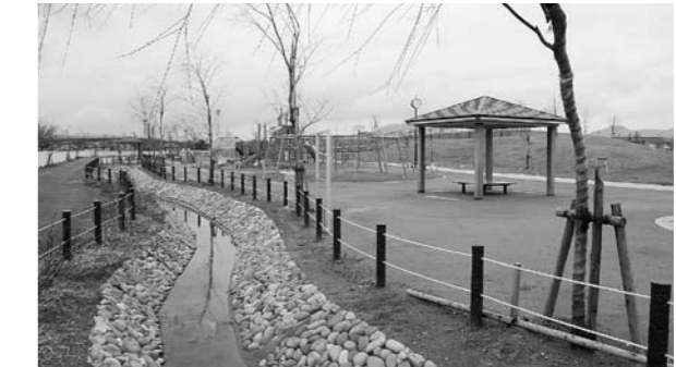
水や緑と親しみながら、楽しく遊んで学べる公園です。

吉田南小学校の新校舎に隣接して工事を進めていた「みなみ親水公園」が、いよいよ4月1日(日)にオープンします。 平成17年度に吉田南小学校の児童などからデザイン画を募集し、公募による市民の皆さんや地元吉田南地区協議会の皆さんとワークショップを重ねながら計画してきました。みんなで一緒に遊びに来てください。 ●見どころ 水辺に親しみ、生き物とふれ合うことができる池と水路。芝滑りやそり滑りもできる見晴らしのよい丘。広い芝生。年齢に合わせた各種遊具を配置し、大人用のフィットネス遊具、ポップアップ噴水やミスト噴水もあります。