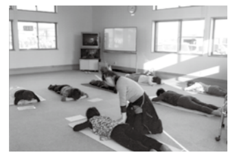
▲「笑健美体操」健康で長生きできる体づくりの骨盤体操