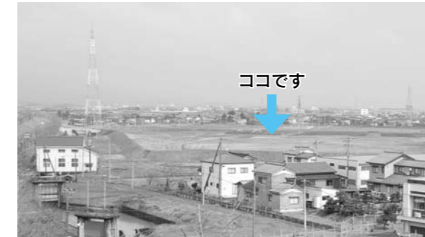
市民の皆さんから親しまれる公園を目指します。

災害時の避難場所としても機能し、訪れる多くの人たちに安らぎを感じ取ってもらえる公園として整備を進めている「大河津分水さくら公園」。造成土の搬入を終え、今後は平成23年春の開園を目指して整備を進めていきます。 この公園が目指す姿は、“みんなで育てる私たちの公園”。園内には、市の木「さくら」を中心に、さくらにちなんだ草花などの植栽を行います。個人や企業・団体の皆さんからも寄付をいただき、「さくらのオーナー」として、育て・維持管理していただける人を募集する予定です。 工事期間中はご迷惑をお掛けしますが、皆様のご理解とご協力をお願いします。