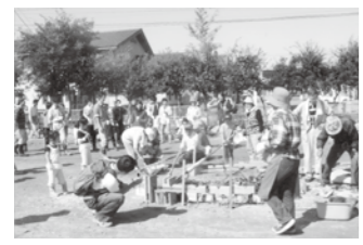
▲「特定非営利活動法人ネットワークみどり緑」須賀郷第2号公園の公園づくり