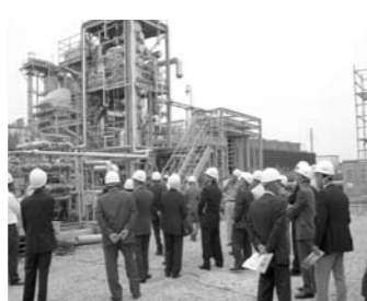
▲バイオエタノールプラントを視察

国のモデル事業として、稲を原料とした純度 99・5% のバイオエタノールの製造プラントを視察しました。 製造されたエタノールはガソリンに 3% 程度混ぜたレギュラーガソリンとして、県内の一部のガソリンスタンドで販売されています。