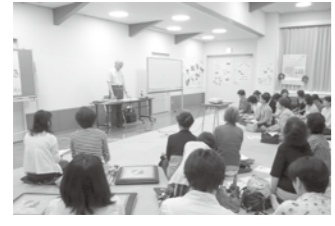
▲「おはなしコロポックル」読み語り講座「おはなしはこころのたねまき」

●申し込み・問い合わせ 所定の書類に必要事項を記入し郵送または持参してください。 〒959-0295 燕市吉田日之出町1番1号 地域振興課市民活動グループ / ☎0256・92・2111 (内線252) / FAX 0256・92・2110 / Eメール: chiiki@city.tsubame.niigata.jp