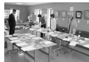
◀審査の様子。力作メニューばかりで審査員も困った様子。