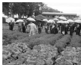
▲種苗育種農場を視察

研修内容は需要に即応できる育種の研究・有機野菜の生産から直営店での消費までの付加価値を求める経営理念などを学びました。