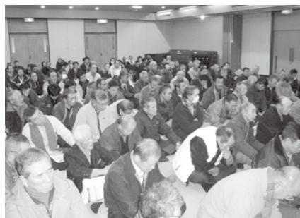
新制度説明会の模様。（2月3日・分水福祉会館）