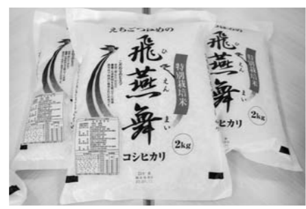
▲新ブランドとして誕生した「飛燕舞」。皆さんもぜひご賞味ください。

○これからの展開 今後は、小売店や飲食店などへ販路を拡大していく予定です。「飛燕舞」の取り扱いを希望する場合は、JA越後中央へ確認後、市への申請を行うことで、販売をすることができます。また、現在の主要な消費地である東京のほか、大阪など大都市圏への売り込みや、インターネットでの販売も考えています。