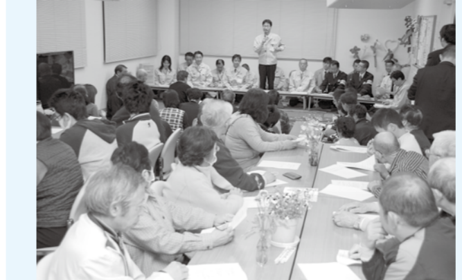
▲3月31日は第一避難所で懇談会が行われました

今後の支援内容の説明や、「どんなことで困っているのか」「何が不足しているのか」「何をしたいのか」など、避難者の皆さんの要望などについて話し合いました。 皆さん共通の心配事は、やはり故郷のことでした。皆さんのご意見にできる限りお応えし、今後の支援に反映していきます。