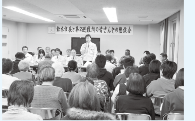
▲4月1日は第二避難所で懇談会が行われました