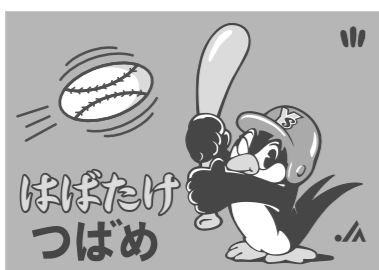
▲今年「つば九郎」を描きます