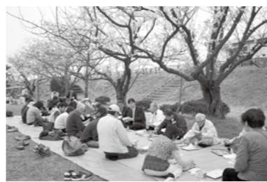
◀ 市長を交えての昼食では、話にも花が咲いていました。

● 大河津分水お花見ツアー 桜の下で満開の笑顔。お酒とお弁当をお供に春はやっぱり花見です。