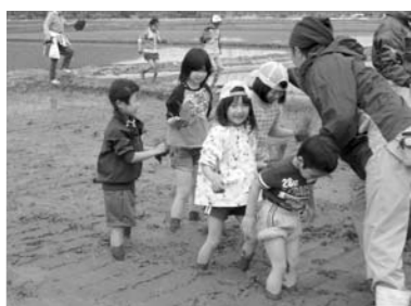
▲昨年の田んぼアートの様子

今年で5年目となる田んぼアートは、農業体験を通じて地域の活性化を図ろうと、燕市景観作物推進協議会の主催で約40アールの水田を利用して行われます。 今回は、大震災からの復興を祈るとともに、夢や希望が未来へ連なるようお願いを込めて、プロ野球・ヤクルトスワローズのキャラクター「つば九郎」を描きます。 当日は、「つば九郎」が棲息地の東京・神宮球場から飛燕。この機会に「つば九郎」と田植えを楽しみませんか! 事前の申し込みは不要です。田植えのできる服装でお気軽にご参加ください。 ●とき 5月28日(土) 午前9時(小雨決行) ●ところ 吉田ふれあい広場西側の田んぼ ●問い合わせ 生産振興課生産振興係(分水庁舎) ☎0256・97・2111 内線431 / 燕市景観作物推進協議会事務局西蒲原土地改良区吉田支所 ☎0256・93・3038