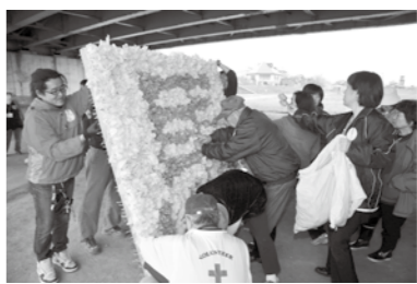
◀ 小雨の降る中、きれいなチューリップで花文字を描く皆さん。

● 花摘みと花絵づくり 市民と一緒にチューリップの花絵づくり。思いはやっぱり故郷に。南相馬市の「馬」の文字を描きました。