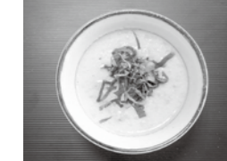
昨年の最優秀賞 「玄米スープ」