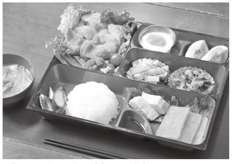
写真はイメージです。当日は内容が異なる場合があります。

芋茎の炒め物 伝統的な農家の郷土料 理。農家のおかあさんた ちの自信作です。 米粉のブラマンジェ 米粉の特徴が生かされ たデザートです。ブレ ンドの割合にひと苦労。い ちじくジャムも手づくり です。 卵焼き 農家ならではの朝ど り卵。産みだての卵を使 った、ふんわり自慢の卵焼 きです。 みそ汁 具は季節の野菜を中心 に、みそはもちろん手づ くりみそを使用。