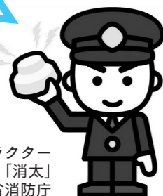
全国消防イメージキャラクター 「消太」