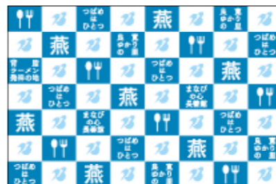
▲市長記者会見のバックパネル

を進めています。後期実施計画では、「財政の健全化」・「行政サービスの向上」・「組織風土の改革」という3つの基本となる柱立てを定めた中で、市を取り巻く社会・経済情勢の変化や、新庁舎への移行などを踏まえ、行政改革に関する取り組みの重点化を図ることとしています。 行政改革の効果のあるもの！ 行政改革は、市民の皆さんの利便性向上や、行政サービスの向上が伴わなければ効果があつたものとは言えません。 策定を進めている後期実施計画の中では、窓口での手続きに関する利便性の向上など市民目線で