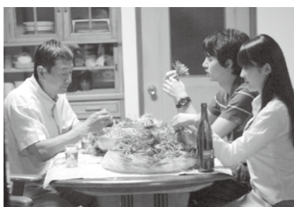
▲新潟特産「かきのもと」も映画に登場

作品に溶け込むことができた と喜んでいました。 私は尚という、母を亡くし父親と弟を母の代わりになつて支えていく女性を演じさせていただきました。家族っていいなと、改めて感じることもできる心暖まる作品になりました。 この映画で、燕市や新潟県のすばらしさを再発見できると思います。ぜひ、皆さんでご覧ください。