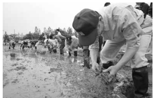
今年の田んぼアートは「昇り龍」を描きます