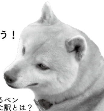
田上家の一員であるペン。ペンが田上家にきた訳とは？

いよいよ新潟公開を来月に控え、今回のシリーズで最終回！ 劇場に行く前にもう一度映画についておさらいをしよう！