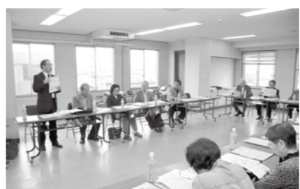
▲ジェネリック医薬品の出前講座