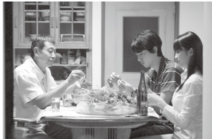
▲映画の中で重要な菊を調理するシーン

●問い合わせ 燕商工会議所内「はばたけ燕実行委員会」☎0256・63・4116（代）