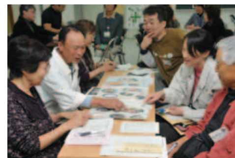
● 10月26日 吉田保健センター 日常の食生活を 見直すきっかけに

「我が家の絶品・朝ごはんレシピ表彰式」が行われ、151件もの応募のうち金賞2件・銀賞1件・特別賞1件が表彰されました。朝ごはんは毎日食べましょう！