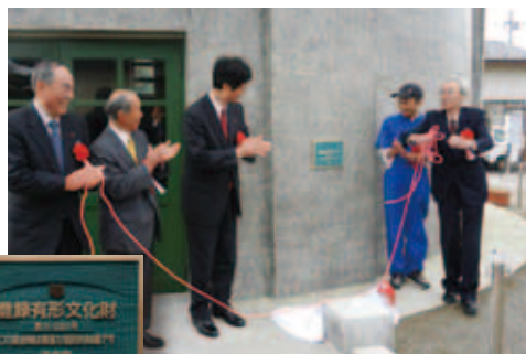
● 11月3日 総合文化センター駐車場 さらに立派になった 水道の塔！

東日本大震災で燕市に避難されていた皆さんと、ボランティアの皆さんが南相馬市で再会し、思い出話に花を咲かせていました。この絆を大事に育てていきたいですね。