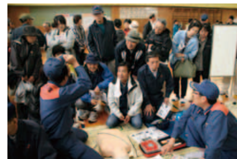
● 10月20日 小池小学校 皆さん、災害への備えは 万全ですか？

燕市農業まつりが行われ、今年はこれまで各地区で行われていたものを一本化し、盛大に開催されました。長蛇の行列ができるブースもあり、大賑わいでした。