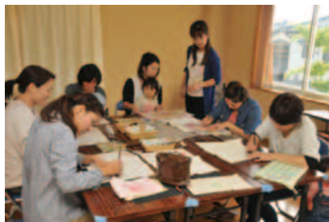
● 11月1日 よした子育て支援センター わーきれい！ 食事が楽しみだわ！

松山市で行われた「東京ヤクルトスワローズカップ少年野球交流大会」。2日間の熱戦が繰り広げられ、燕市代表チームは見事に準優勝を収めました。