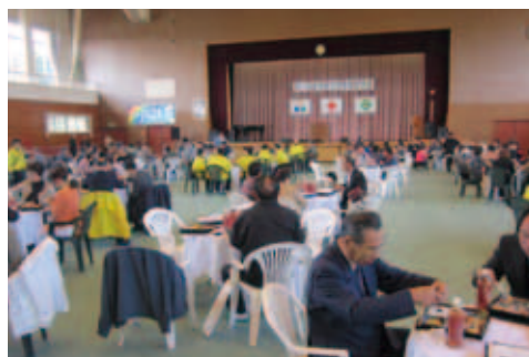
● 11月2日 福島県南相馬市 南相馬市と燕市の絆： 大切に育てます

ランチョンマットにお花や動物などの型をあてて、色落ちしない特殊な絵の具でカラフルに塗っていきます。世界に一つのランチョンマットが完成しました。