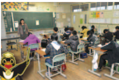
● 11月11日 市内全小学校 Aクラスの満点者には 特製ピンバッジを贈呈

吉田ふれあい広場で行われたドッグランイベント。当日はあいにくの雨天で、全てのプログラムを行うことができませんでしたが、犬とふれあう楽しい時間となりました。