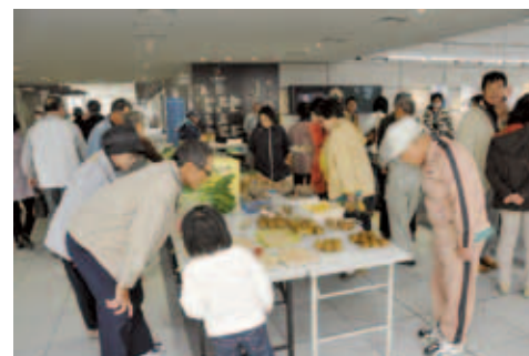
● 10月27日 燕市役所 今年もたくさんさんの実りを ありがとう

燕市農業まつりが行われ、今年はこれまで各地区で行われていたものを一本化し、盛大に開催されました。長蛇の行列ができるブースもあり、大賑わいでした。