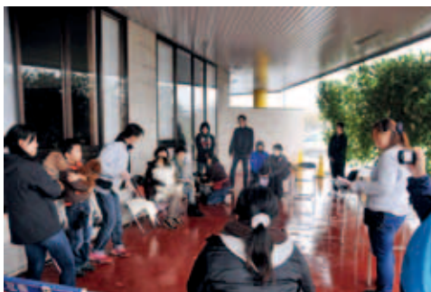
● 11月10日 吉田ふれあい広場 わんちゃんと 楽しく遊ぼう

吉田ふれあい広場で行われたドッグランイベント。当日はあいにくの雨天で、全てのプログラムを行うことができませんでしたが、犬とふれあう楽しい時間となりました。