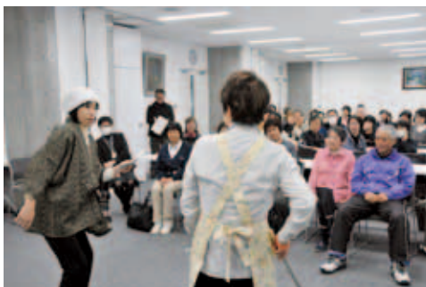
● 11月15日 燕市役所 まずは学ぶことから 始めましょう

第2回ジュニア検定が行われ、今年は最難関Aクラスで6人の満点者が出るなど、皆さん頑張りました。詳しくは市長が紙上ブログで掲載していますのでご覧ください。