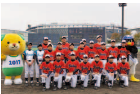
● 11月16・17日 愛媛県松山市 スワローズカップ 野球大会で準優勝！

認知症を理解し、認知症の人や家族を見守る「認知症サポーター」の養成講座が開催されました。この日は54人の認知症サポーターが誕生しました。