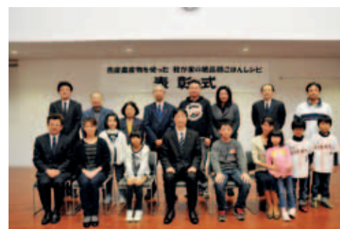
● 10月31日 燕市役所 朝食をしっかりと食べる 習慣をつけましょう

燕第一地区まちづくり協議会区域にて行われた避難訓練。あいにくの雨模様でしたが、皆さん真剣に訓練に臨んでいました。写真はAED講習の様子です。