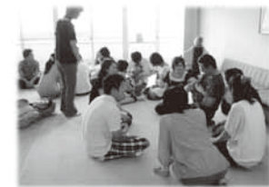
▲ハッピーベビークラブ 両親学級編

ママの楽しい気持ちは赤ちゃんに伝わります。マタニティライフを楽しめるハッピーベビークラブにお越しください。出会い、分かち合い、育ち愛を保