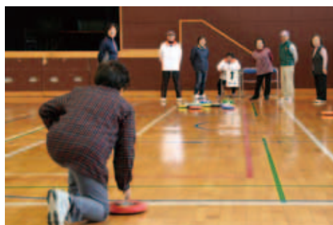
● 11月10日 吉田総合体育館 ねらいを定めて、 真つすぐに進んで…

市のシンボルとして親しまれている「水道の塔」。国の登録有形文化財となったことで、この日、水道の塔に登録有形文化財プレートが設置されました。