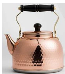
IH 対応 鋳目入りケトル