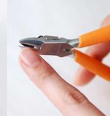
天使の爪切 ネイルニッパー