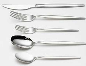
ラッキーウッド 「ミルトアシリーズ」