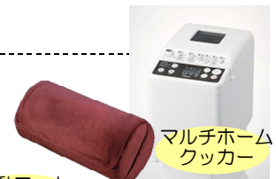
振動フット マッサージャー

＜参加者の声＞ 6.5 kgの減量に成功／健診結果が「正常」に／休肝日を無理なく続けるきっかけに／血圧と体重の測定が毎日の習慣に など