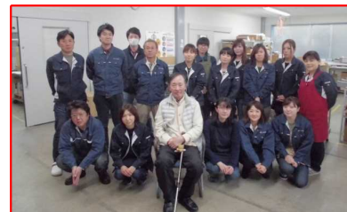
コーダ工業株式会社 様

自ら車いすダンサーとして競技に取り組み、車いすダンスを通じて障がい者と健常者をつなぎ、お互いがいきいきと輝けるきかけづくりに取り組んでおり、障がい者支援での活躍が期待できると評価。