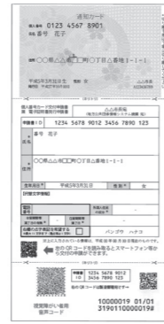
交付申請書の見本