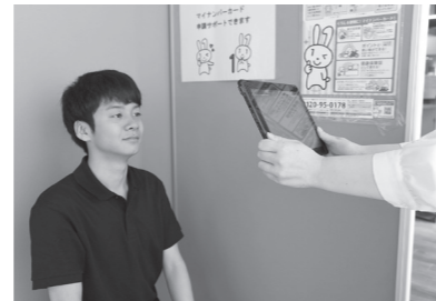
写真は市役所でも撮影できます (タブレット端末で撮影)